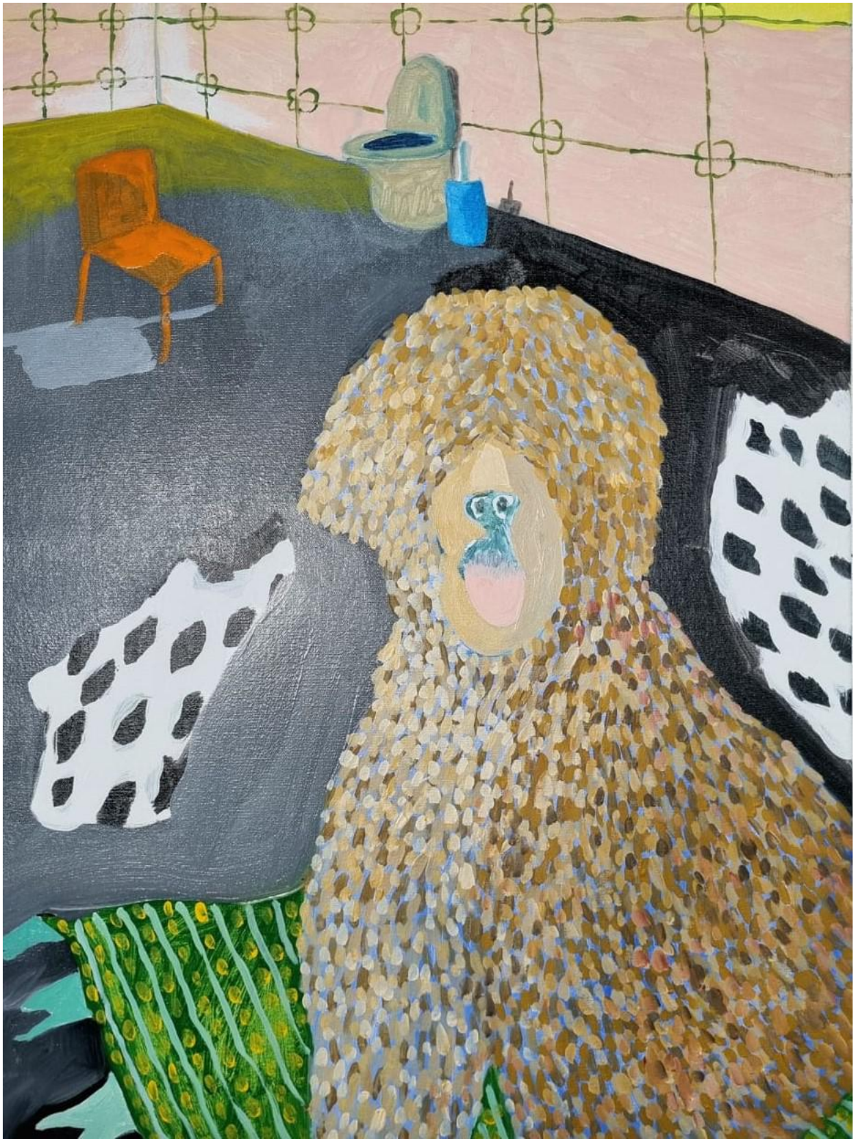
Manuel Forte Cold Turkey , 2024 Oil, acrylic and oil sticks on canvas 80 x 60 cm 6,000 USD