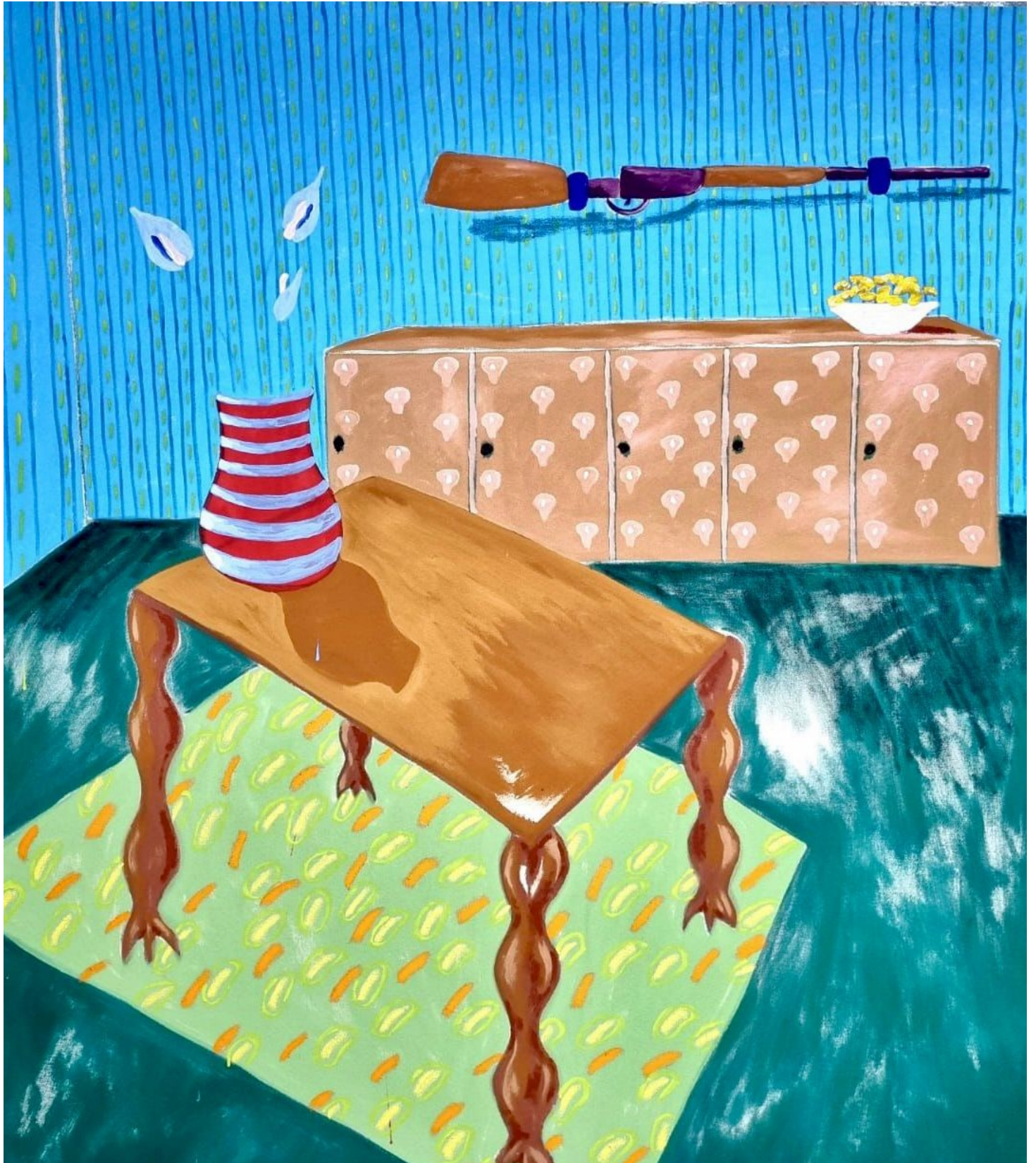
Manuel Forte Popcorn , 2024 Acrylic and oil sticks on raw canvas 180 x 160 cm 10,000 USD