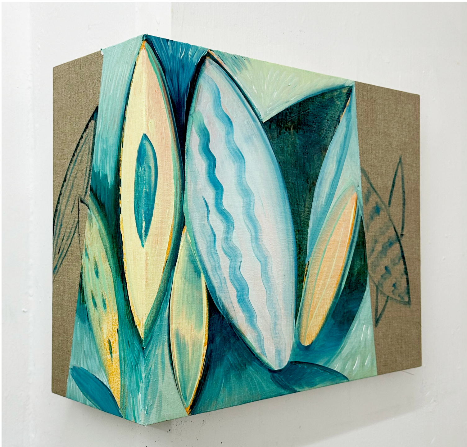
Allan Villavicencio Sombra azul , 2024 Oil on linen on wood panel 28.5 x 34.5 x 13 cm 7,500 USD