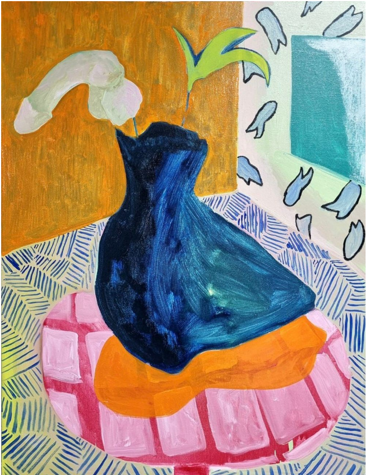
Manuel Forte After Eight, 2024 Oil, acrylic and oil sticks on canvas 80 x 60 cm 6,000 USD